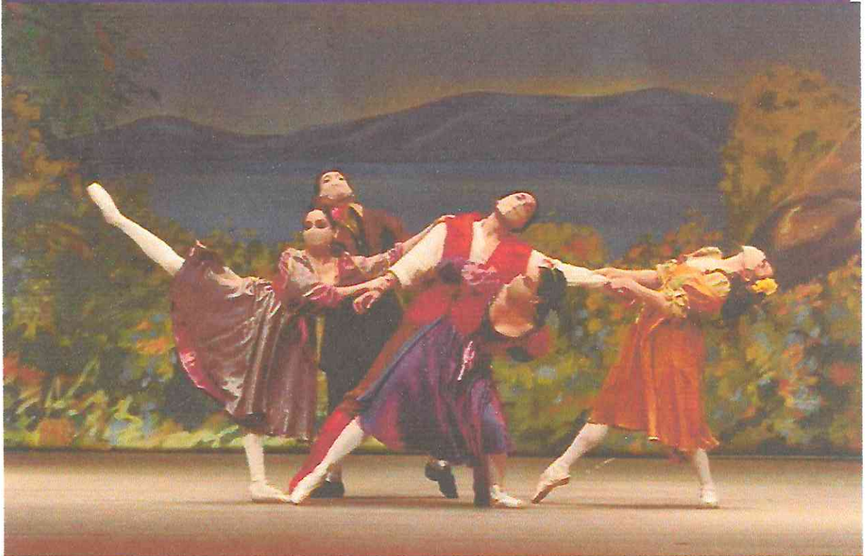
Escena de Gaston y la Bestia (batalla), Gaston, Lefou y Enamoradas. Marzo 2022