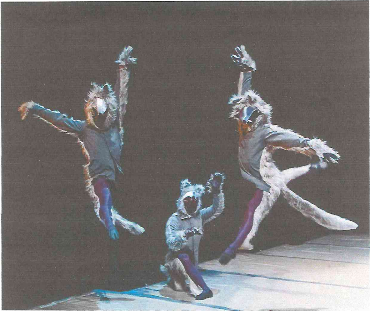
Escena de los Lobos "La Bella y la Bestia" Marzo 2022