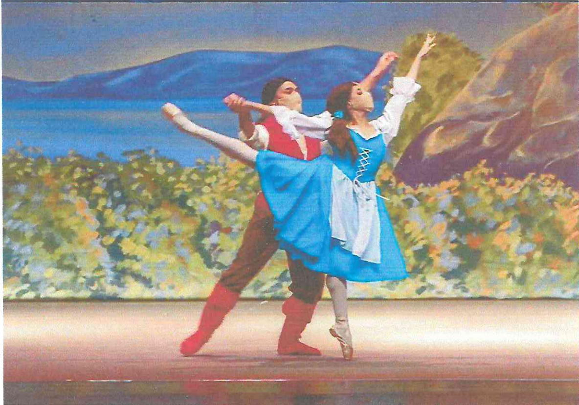
Escena de Gaston con Bella y de la Batalla. Marzo 2022